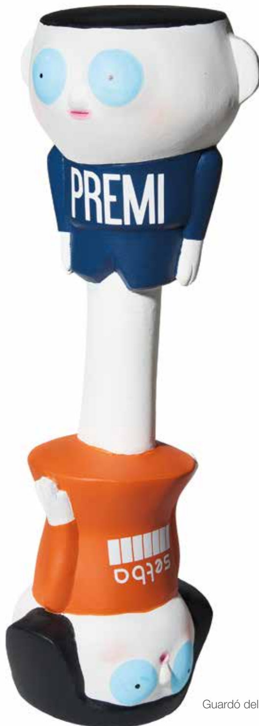
Guardó del Premi Setba creat per l'artista Meritxell Duran

Bases del certamen de pintura i de disseny per artistes amb discapacitat intel·lectual XI edició